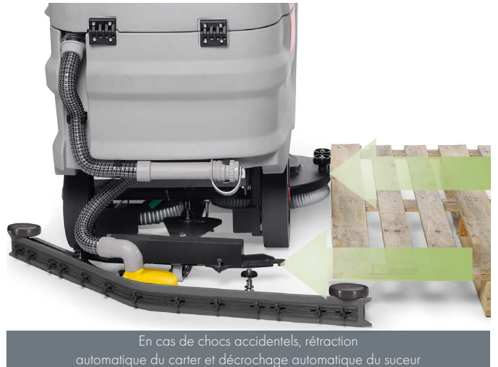
En cas de chocs accidentels, rétraction automatique du carter et décrochage automatique du suceur